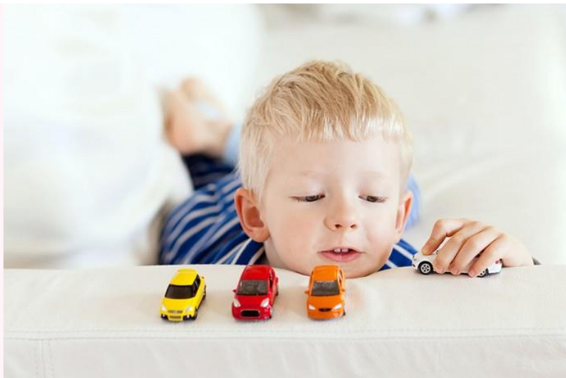
Режиссерская игра у детей 2-3 лет — предпосылка к более сложной, сюжетно-ролевой.