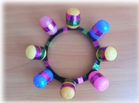
ПАЛКА - ШУМЕЛКА