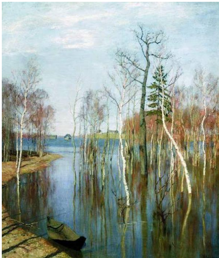
«Весна. Большая вода». (1897). Левитан И. И.

Весна, весна! Как воздух чист! Как ясен небосклон! Своей лазурию живой Слепит мне очи он.