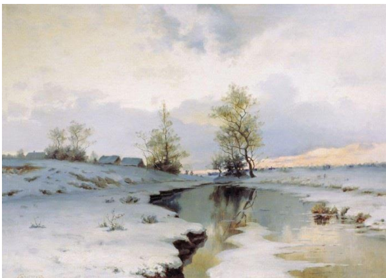
«Начало весны». 1890-е. Автор: Ендогуров Иван Иванович.

Шумят ручьи! Блестят ручьи! Взревев, река несет На торжествующем хребте Поднятый ею лед!